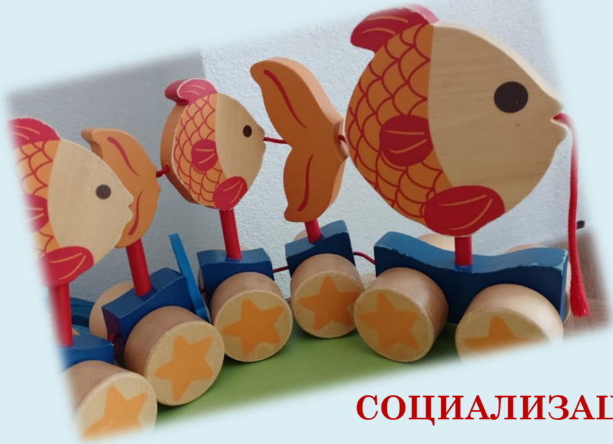
СОЦИАЛИЗАЦИЯ В РАЗНОВЪЗРАСТОВА ГРУПА